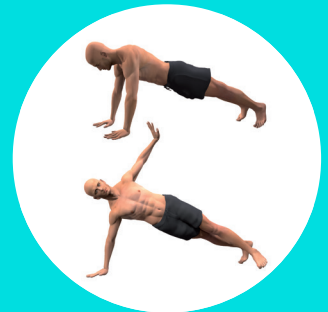
PLANCHE + ROTATIONS