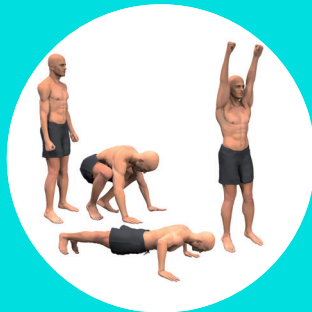
BURPEES + POMPES