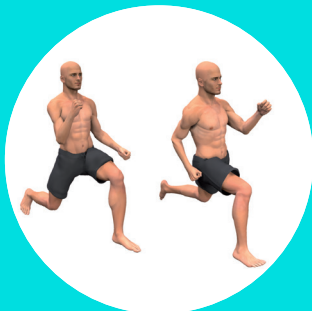
FENTES SAUTÉES ALTERNÉES